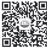
电力标准信息微信