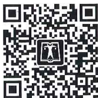
中国电力出版社官方微信